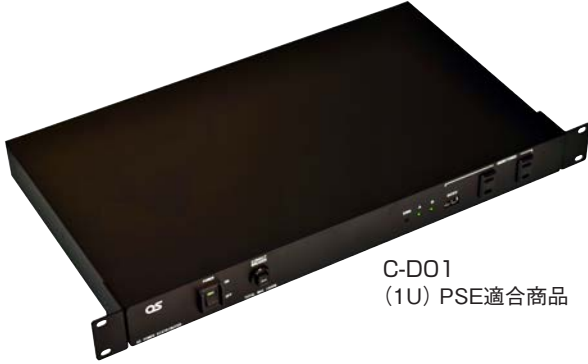
C-D01 (1U) PSE適合商品