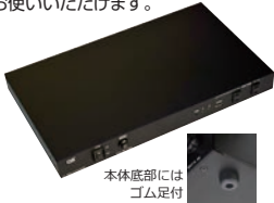
本体底部には ゴム足付

脱着型EIA金具 (1U) 卓上で使用する場合には、金具を外し、すっきりとした形でお使いいただけます。