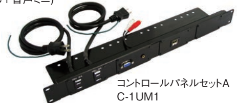
コントロールパネルセットA C-1UM1