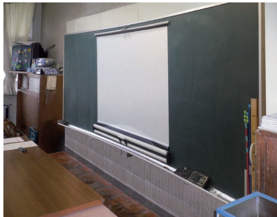
左:EEU-3612B1本体(黑板取付前) 上:曲面黑板取付時 弊社WSM-070WC-MV2 マグネット式スクリーン取付状態

平面・曲面黑板、ホワイトボードに適合。 装置本体が見えないので違和感も全くなし。