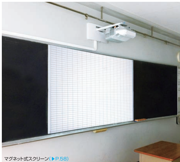
マグネット式スクリーン(▶P.58)

電子黒板対応プロジェクターを設置し、ホワイトボード機能も有するマグネット式スクリーンを納入。プロジェクターへの映像ケーブルは鍵付のボックス内にパネルを作り、未使用時には鍵をかけていたずら防止対策をしています。