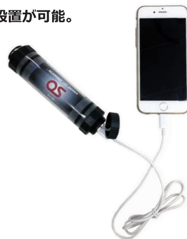
スマートフォンへ充電 スマートフォンと接続ケーブル は付属してありません。