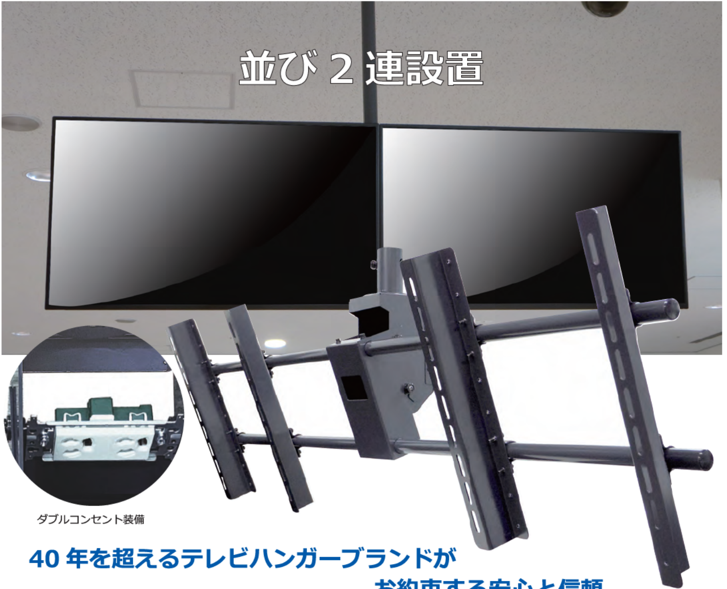
ダブルコンセント装備