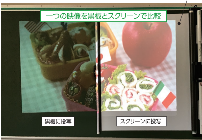
一つの映像を黒板とスクリーンで比較

一般的な普通教室におけるプロジェクターは3000~4000lmですが、高い数値の製品を使用した場合でも、スクリーンがないとプロジェクター本来の性能を発揮できず、暗くくすんだ映像となります。