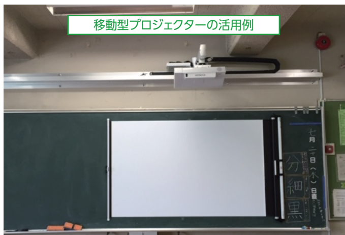
移動型プロジェクターの活用例