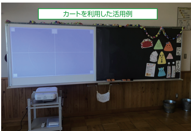
カートを利用した活用例

プロジェクターをカートに乗せ、各教室間を移動させて使用しています。