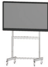
既に教室導入済みのディスプレイスタンド