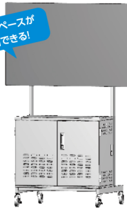
充電保管庫ディスプレイスタンド