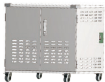
型式 TC-200-W 色:ホワイト