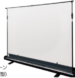
シールドスクリーン (フロアスタンド型)

対面授業や音楽室など、感染症予防に役立つ透明生地のスクリーン。立ち上げ式のため、コンパクトに収納できて持ち運びも可能。