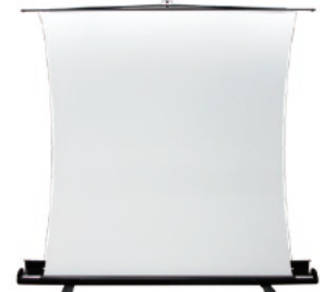
フロアスタンドスクリーン

オンライン授業で生徒の顔が大きく映る! 表情も見える! 持ち運びができ、教室間を移動しての利用も可能。