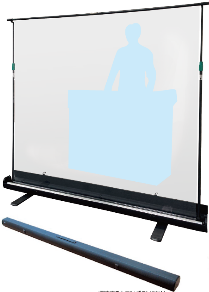
収納するとコンパクトになり 持ち運びが可能

透明なスクリーンを引き上げて使用するシールドスクリーン。 収納するとコンパクトになり、持ち運びもできます。