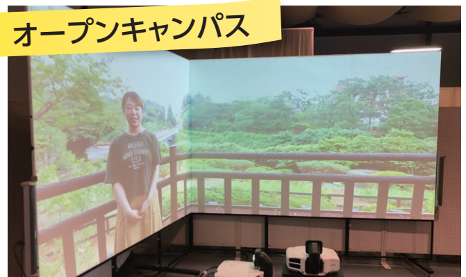
リアリティあふれるオープンキャンパス