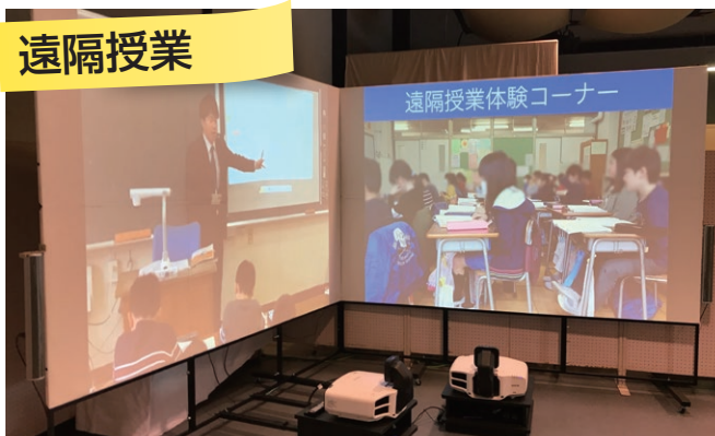
小規模学校と大規模学校をつなぐ遠隔授業