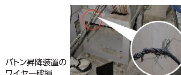
バトン昇降装置のワイヤー破損