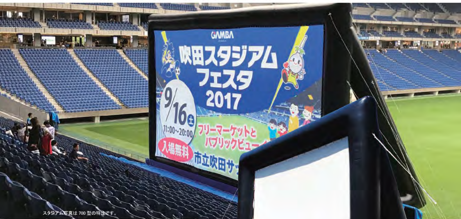
スタジアム写真は700型の特注です。 切抜き写真は120型のプロトタイプです。

空気で自立する移動型大型スクリーン。 屋内外で使えるオーエスインフレータースクリーン。