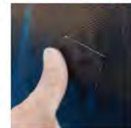
緊急補修用 粘着シートも付属 しています。