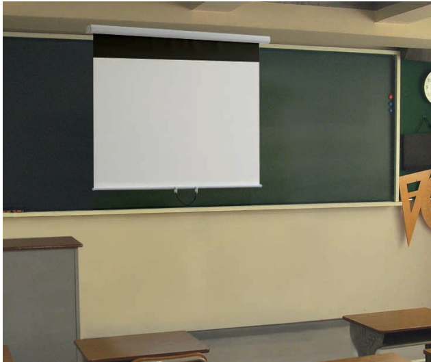
【写真】 WSM-068F-FV2 レール無

黒板に全面密着する安定感と平面性。 ソフトウインドとボールストップ機構を 備えたマグネットスクリーン。