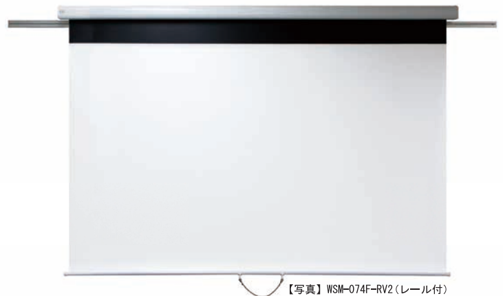
【写真】 WSM-074F-RV2 (レール付)