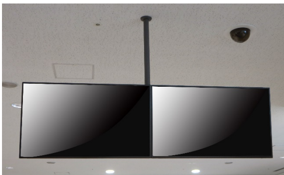
■ DH-480 2連設置