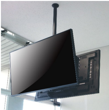
■ DH-470 横型設置