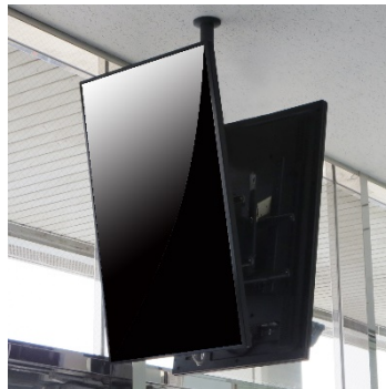
■ DH-470 縦型設置