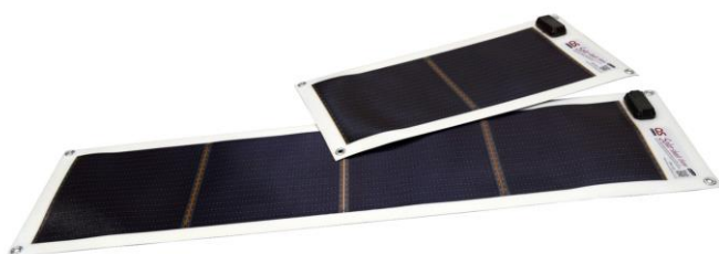
ソーラーシートチャージャー GN-050(上)、GN-100(下)