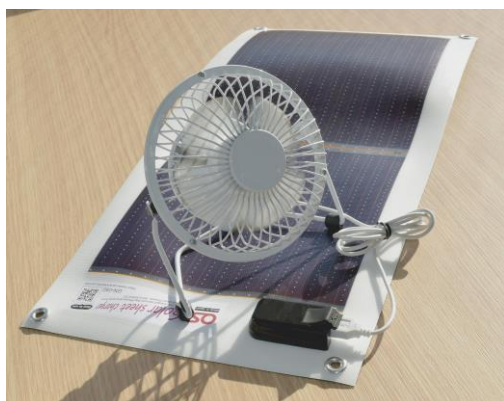
PC用小型扇風機に給電