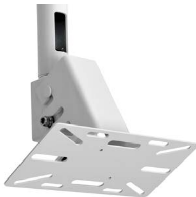
スピーカー取付金具 A