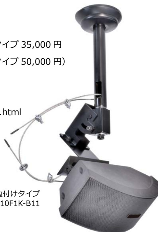
天井直付けタイプ HSC-010F1K-B11

https://jp.os-worldwide.com/products/hanger/hsc.html